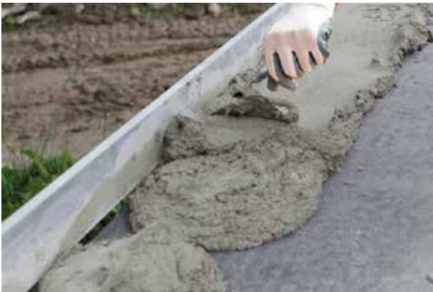
Anlegen einer Ausgleichsschicht

Die unvermeidbaren Unebenheiten des Wandauf-lagers (Betondecke, Betonfundament etc.) müssen bei Dünnbettmauerwerk durch eine gesonderte Mörtelschicht (Ausgleichsschicht) ausgeglichen werden. Diese Mörtelschicht ist in der Regel dicker als eine Dünnbettfuge. Bewährt haben sich Mauer-mörtel der Mörtelklasse M10. Die Ausgleichsschicht soll im Mittel nicht dicker als 3 cm, an einzelnen Stellen höchstens 5 cm dick sein.